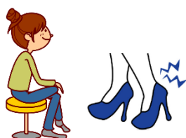
足を組んで座る きつい靴を履く