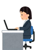
長時間同じ姿勢をとる