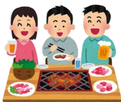
お酒の飲みすぎ 塩分のとり過ぎ